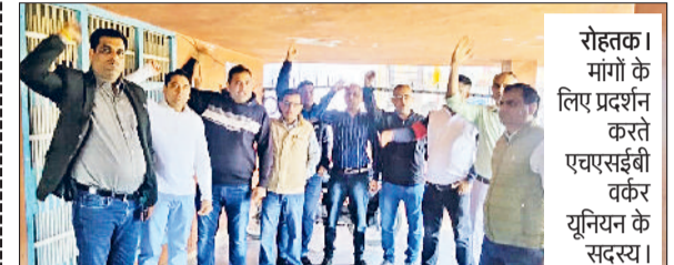
रोहतक। मांगों के लिए प्रदर्शन करते एचएसईबी वर्कर यूनियन के सदस्य।

रोहतक। केंद्रीय माध्यमिक शिक्षा बोर्ड (सीबीईएसई) की ओर से शुक्रवार को आयोजित 12वीं कक्षा की फिजिक्स (भौतिक विज्ञान) की परीक्षा ने विद्यार्थियों को खास पसीना छुड़ाया। रोहतक के 24 परीक्षा केंद्रों पर हुई इस परीक्षा में प्रश्न पत्र का स्वरूप उम्मीद से अधिक गणनात्मक (न्यूमेरिकल्स) रहा, जिसके चलते कई छात्र अपना पूरा पेपर हल करने में भी असमर्थ रहे। परीक्षा देकर केंद्रों से बाहर निकले विद्यार्थियों के चेहरों पर मिली-जुली प्रतिक्रिया देखने को मिली। अधिकांश छात्रों का कहना था कि संकेतन-सी में पूछे गए तीन-तीन अंकों के न्यूमेरिकल सवालों ने उन्हें काफी उलाहना दी। ये सवाल न केवल कठिन थे, बल्कि इन्हें हल करने में समय भी बहुत अधिक लगा। उन्होंने बताया कि पेपर पूरी तरह एनर्सीईआरटी पर आधारित था, लेकिन न्यूमेरिकल सवालों की अधिकता के कारण अन्य प्रश्नों के लिए समय कम पड़ गया। विद्यार्थियों ने बताया कि न्यूमेरिकल्स को हल करने में काफी समय बर्बाद हुआ, जिससे लंबे उतर वाले सवालों के लिए समय प्रबंधन करना मुश्किल हो गया। हालांकि, मॉडर्न फिजिक्स के खंड को छात्रों ने तुलनात्मक रूप से आसान बताया।