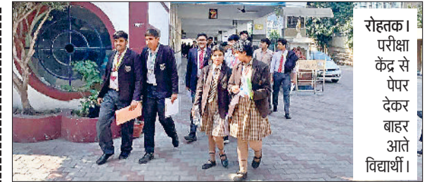
रोहतक। परीक्षा केंद्र से पेपर देकर बाहर आते विद्यार्थी।

रोहतक। यात्रियों की लंबे समय से चली आ रही मांग को देखते हुए उत्तर रेलवे ने लाखनमाजरा (एनएनएमएर) रेलवे स्टेशन पर दो पैसैंजर ट्रेनों के ठहराव को मंजूरी दे दी है। रेलवे की ओर से जारी आदेश के अनुसार ट्रेन संख्या 54031 दिल्ली-जींद पैसैंजर और 54024 जींद-दिल्ली पैसैंजर अब 23 फरवरी 2026 से लाखनमाजरा स्टेशन पर नियमित रूप से रुकेगी। इस फैसले से क्षेत्र के हजारों यात्रियों को सीधा लाभ मिलने की उम्मीद है। रेलवे मुख्यालय, नई दिल्ली ने जारी पत्र में स्पष्ट किया गया है कि फिलहाल यह ठहराव प्रायोगिक आधार पर दिया गया है। यदि यात्रियों की संख्या और टिकट बिक्री संतोषजनक रहती तो इसे स्थायी रूप दिया जा सकता है। रेलवे प्रशासन ने संबंधित वाणिज्य विभाग को निर्देश दिए हैं कि पांच माह तक टिकटों की बिक्री और यात्री संख्या का आकलन कर रिपोर्ट मुख्यालय को भेजी जाए। समय सारिणी के अनुसार 54024 जींद-दिल्ली पैसैंजर शाम 7:38 बजे लाखनमाजरा पहुंचेगी और एक मिनट के ठहराव के बाद 7:39 बजे रवाना होगी। वहीं 54031 दिल्ली-जींद पैसैंजर दोपहर 2:10 बजे स्टेशन पहुंचेगी और 2:11 बजे प्रस्थान करेगी। इस निर्णय से लाखनमाजरा तथा आसपास के ग्रामीण क्षेत्रों के विद्यार्थियों, नौकरोंपेशा लोगों, छोटे व्यापारियों और दैनिक यात्रियों को बड़ी राहत मिलेगी। अब उन्हें निकटवर्ती बड़े स्टेशनों तक अतिरिक्त दूरी तय नहीं करनी पड़ेगी।