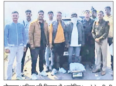
रोहतक। पुलिस की गिरफ्त में आरोपित।

जानकारी के अनुसार सीआईए-1 की टीम एएसआई अमित के नेतृत्व में सांपला