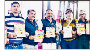
रोहताक। सम्मेलन को लेकर व्यापक जनसंपर्क अभियान के दौरान पोस्टर दिखाते श्री महादेव हिंदू सम्मेलन समिति के सदस्य।