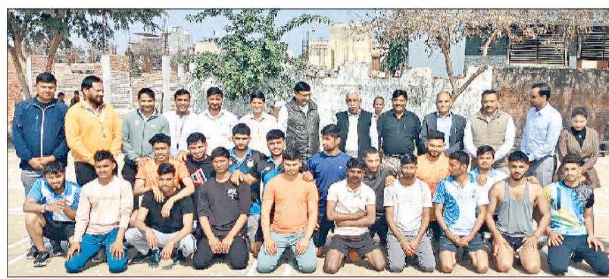
हरिभूमि न्यूज़ २२ रोहताक