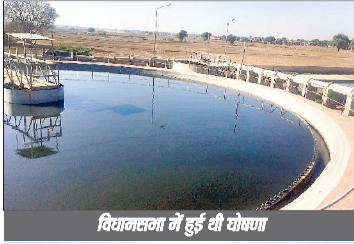
विधानसभा में हुई थी घोषणा

वर्तमान में शहर में चार जलघर संचालित हो रहे हैं, जो लगभग छह लाख की आबादी को पेयजल उपलब्ध करा रहे हैं। हालांकि जनसंख्या वृद्धि और शहरी विस्तार के कारण मौजूदा संसाधनों पर दबाव लगातार बढ़ता जा रहा है। गर्मियों के मौसम में कई इलाकों में पानी की किल्लत की शिकायतें सामने आती रहती हैं। लोगों को पानी की डिमांड पूरी करवाने के लिए धरने, प्रदर्शन और रोड़ जाम तक करने पड़ जाते हैं। ऐसे में गढ़ी बोहर में प्रस्तावित नया जलघर शहर की जलापूर्ति व्यवस्था को